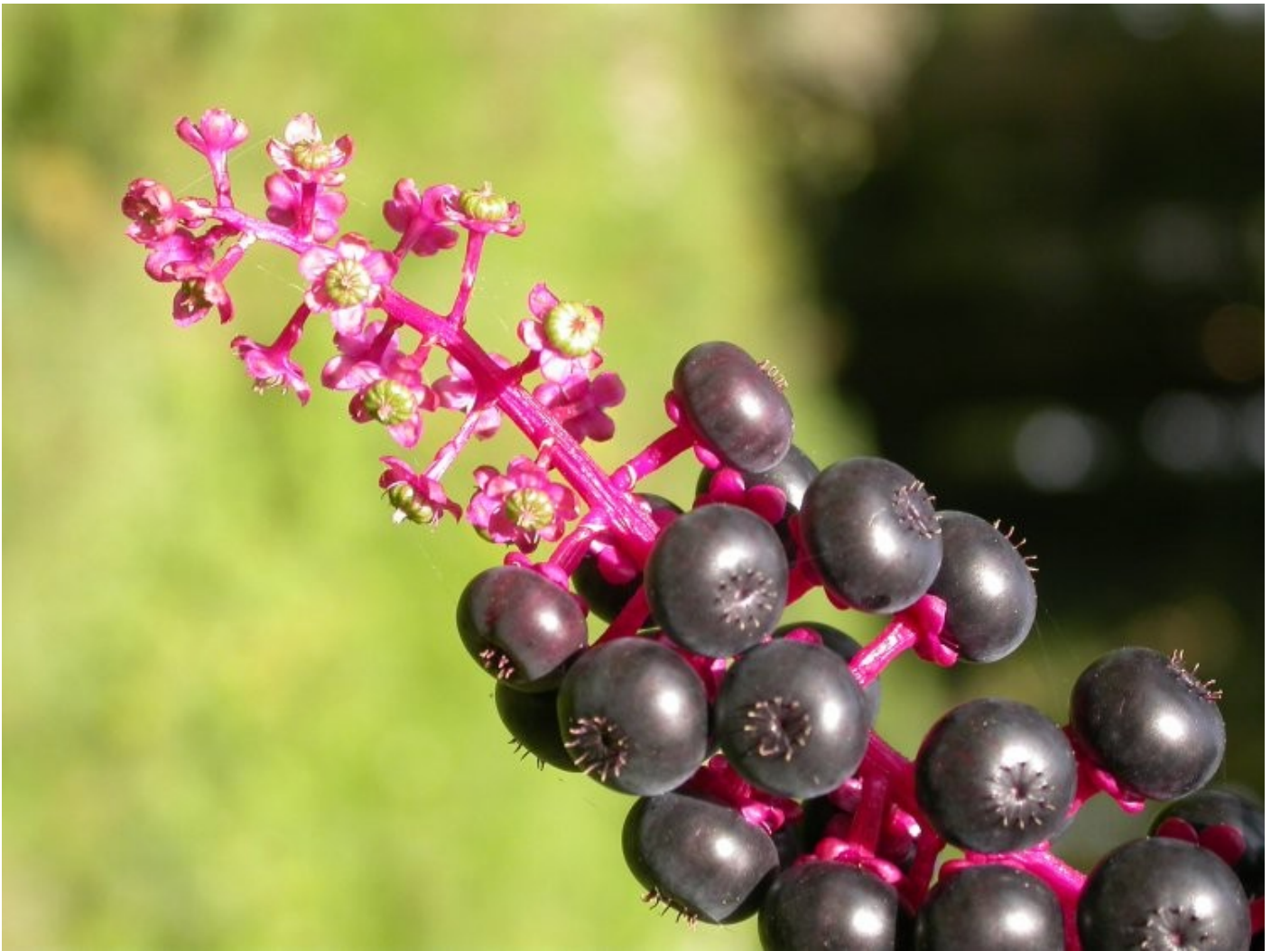
Phytolacca americana dans une coupe forestière - Domaine des Barres Nogent sur Vernisson (45) [Yann Dumas]