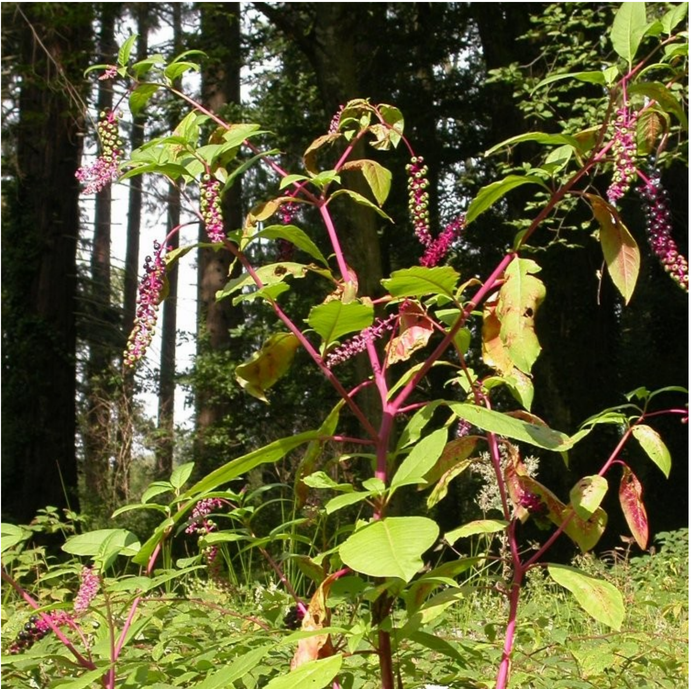
Phytolacca americana dans une coupe forestière - Domaine des Barres Nogent sur Vernisson (45) [Yann Dumas]