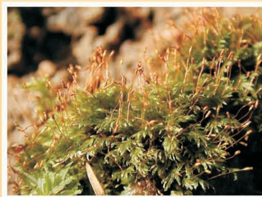
Fissidens bryoides (mousse) ML