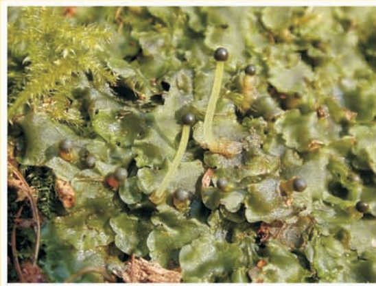
Pellia epiphylla (hépatique) ML