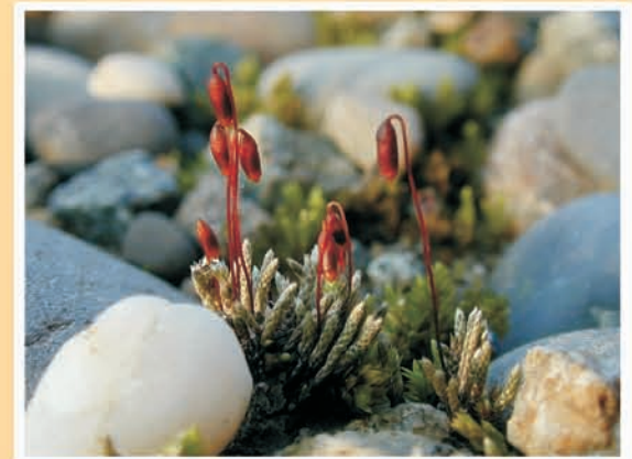
Bryum argenteum (mousse) ML