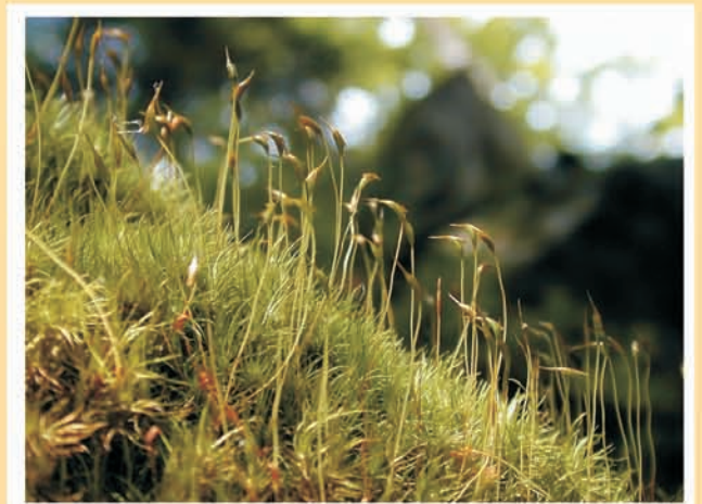
Dicranum scoparium (mousse) ML