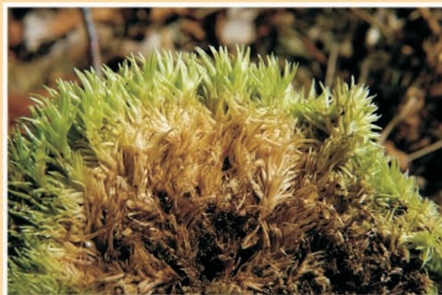
Leucobryum glaucum (mousse) CC