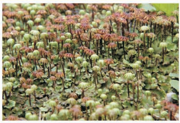
Marchantia polymorpha (hépatique) CC