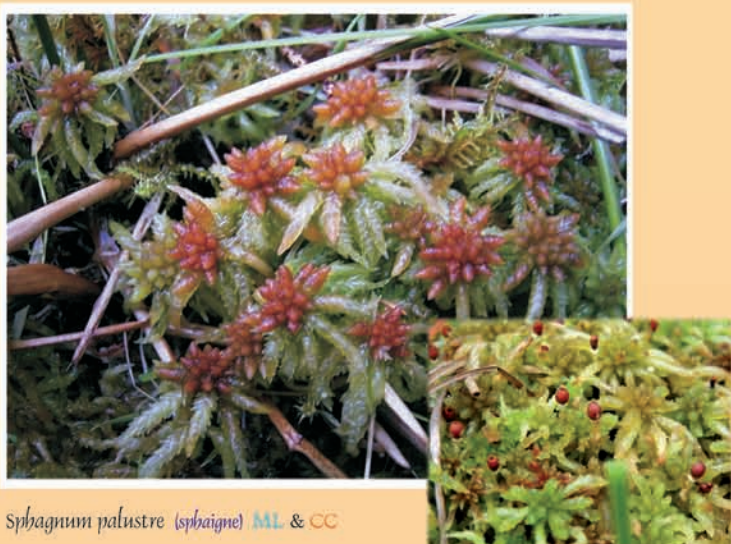
Sphagnum palustre (sphaigne) ML & CC