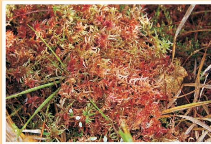
Sphagnum rubellum (sphaigne) CC