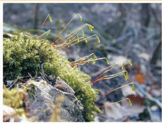
Mnium hornum (mousse) ML