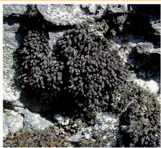
Andreaea rotundifolia (mousse) ML