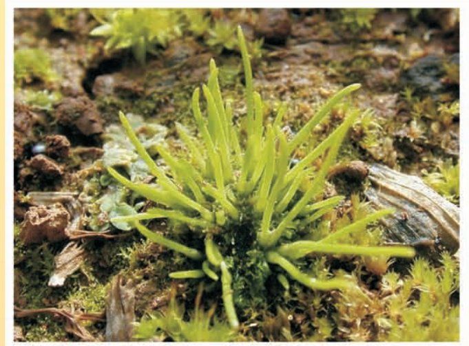
Anthoceros agrestis (anthocérote) ML