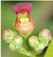
à inconnu observée le 12 juin 2013 par Marie Portas

Réseau Tela botanica, Programme Flora Data, version dynamique.