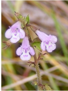
à inconnu observée le 1 novembre 2004 par Alain Bigou

Réseau Tela botanica, Programme Flora Data, version dynamique.