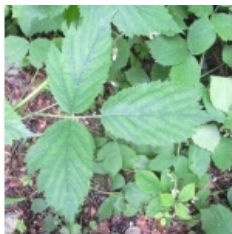
à inconnu observée le 15 juillet 2012 par David Mercier

Réseau Tela botanica, Programme Flora Data, version dynamique.