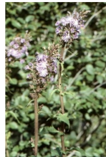
à inconnu observée le 10 juillet 2003 par Liliane Roubaudi

Réseau Tela botanica, Programme Flora Data, version dynamique.