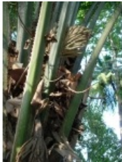
à inconnu observée le 2 mars 2006 par Genevieve Botti

Réseau Tela botanica, Programme Flora Data, version dynamique.