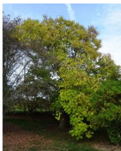
à inconnu observée le 25 octobre 2015 par Alain Bigou

Réseau Tela botanica, Programme Flora Data, version dynamique.