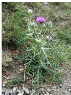
à inconnu observée le 30 août 2016 par Alain Bigou

Réseau Tela botanica, Programme Flora Data, version dynamique.