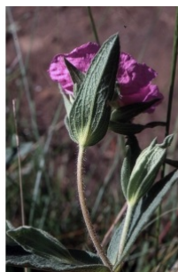
à inconnu observée le 20 mai 2002 par Liliane Roubaudi

Réseau Tela botanica, Programme Flora Data, version dynamique.