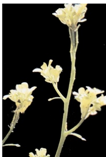
à inconnu observée le 5 août 2006 par Liliane Roubaudi

Réseau Tela botanica, Programme Flora Data, version dynamique.