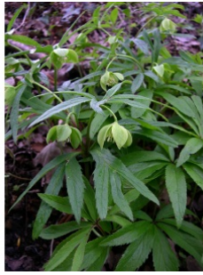
à inconnu observée le 16 avril 2006 par Claire Felloni

Réseau Tela botanica, Programme Flora Data, version dynamique.