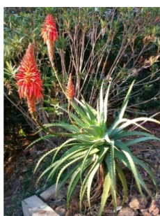
à inconnu observée le 1 janvier 2017 par Bertrand Bonnet

Réseau Tela botanica, Programme Flora Data, version dynamique.