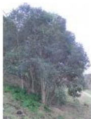
à inconnu observée le 10 février 2013 par Pierre Bonnet

Réseau Tela botanica, Programme Flora Data, version dynamique.