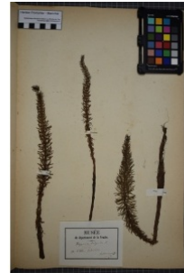
à inconnu observée le 1 juillet 1852 par Herbier Pontarlier-marichal

Réseau Tela botanica, Programme Flora Data, version dynamique.