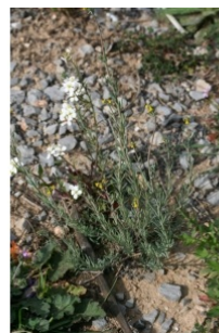
à inconnu observée le 4 mars 2007 par John De Vos

Réseau Tela botanica, Programme Flora Data, version dynamique.