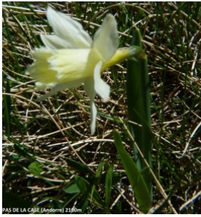
à inconnu observée le 26 juin 2015 par Dominique Duveau

Réseau Tela botanica, Programme Flora Data, version dynamique.