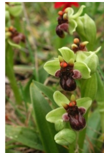
à Inconnu observée le 13 avril 2003 par John De Vos

Réseau Tela botanica, Programme Flora Data, version dynamique.