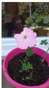
à inconnu observée le 28 mai 2017 par Mélie Ollivier

Réseau Tela botanica, Programme Flora Data, version dynamique.