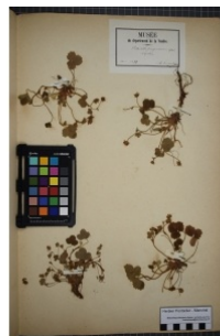
à inconnu observée le 1 mai 1887 par Herbier Pontarlier-marichal

Réseau Tela botanica, Programme Flora Data, version dynamique.