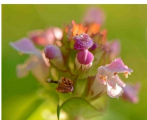
à inconnu observée le 21 juin 2016 par Cubjaco

Réseau Tela botanica, Programme Flora Data, version dynamique.