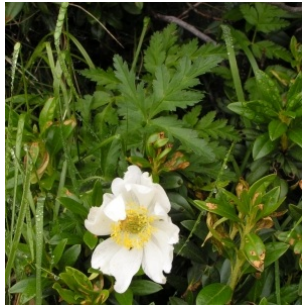
à inconnu observée le 8 juillet 2005 par Alain Bigou

Réseau Tela botanica, Programme Flora Data, version dynamique.