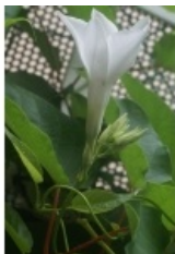
à inconnu observée le 23 juillet 2007 par Liliane Roubaudi

Réseau Tela botanica, Programme Flora Data, version dynamique.