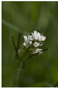
à inconnu observée le 3 juin 2016 par Jean Paul Saint Marc

Réseau Tela botanica, Programme Flora Data, version dynamique.