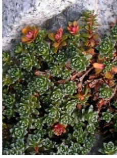
à inconnu observée le 9 octobre 2004 par Alain Bigou

Réseau Tela botanica, Programme Flora Data, version dynamique.