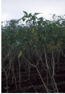
à inconnu observée le 13 janvier 2002 par Liliane Roubaudi

Réseau Tela botanica, Programme Flora Data, version dynamique.