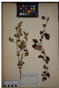
à inconnu observée le 9 septembre 180 par Herbier Pontarlier-marichal

Réseau Tela botanica, Programme Flora Data, version dynamique.