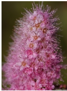
à inconnu observée le 27 juin 2014 par SandrinePhotos

Réseau Tela botanica, Programme Flora Data, version dynamique.