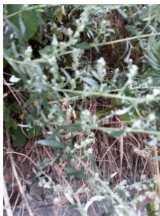
à inconnu observée le 8 août 2018 par Bertrand Bouissou

Réseau Tela botanica, Programme Flora Data, version dynamique.