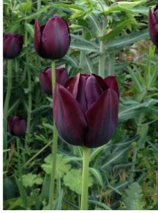
à inconnu observée le 27 avril 2014 par endroitn@...

Réseau Tela botanica, Programme Flora Data, version dynamique.