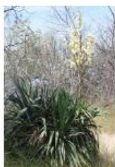
à inconnu observée le 4 juin 2012 par Marie Portas

Réseau Tela botanica, Programme Flora Data, version dynamique.