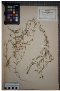
à inconnu observée le 1 juin 1852 par Herbier Pontarlier-marichal

Réseau Tela botanica, Programme Flora Data, version dynamique.