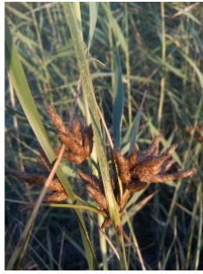
à inconnu observée le 12 août 2015 par Samantha Bazan

Réseau Tela botanica, Programme Flora Data, version dynamique.