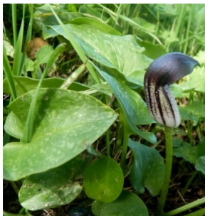
à inconnu observée le 16 février 2014 par Ans Gorter

Réseau Tela botanica, Programme Flora Data, version dynamique.