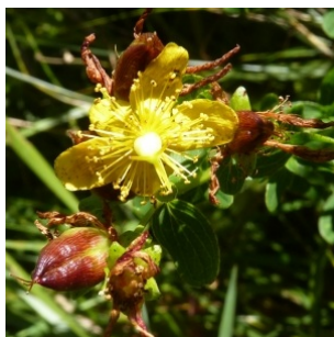
à inconnu observée le 19 août 2013 par Ans Gorter

Réseau Tela botanica, Programme Flora Data, version dynamique.