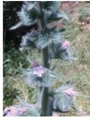
à inconnu observée le 26 mai 2012 par Genevieve Botti

Réseau Tela botanica, Programme Flora Data, version dynamique.