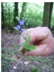
à inconnu observée le 27 avril 2008 par Benjamin Deslandes

Réseau Tela botanica, Programme Flora Data, version dynamique.