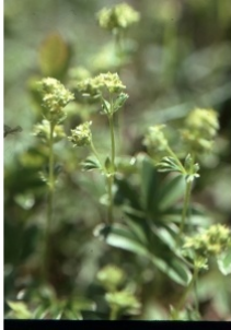
à inconnu observée le 6 juillet 1999 par Liliane Roubaudi

Réseau Tela botanica, Programme Flora Data, version dynamique.