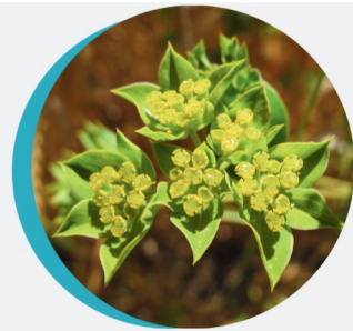
Buplèvre Bupleurum rotundifolium L.