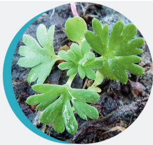
Alchémille des champs Aphanes arvensis L.