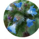
BUGLOSSE DES CHAMPS