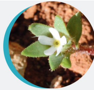
Androsace des champs Androsace maxima L.