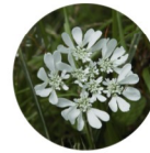
ORLAYA À GRANDES FLEURS