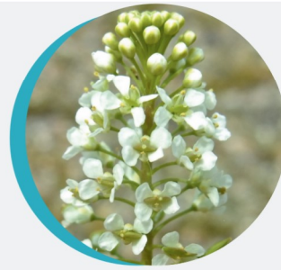
Tabouret des champs Thlaspi arvense L.