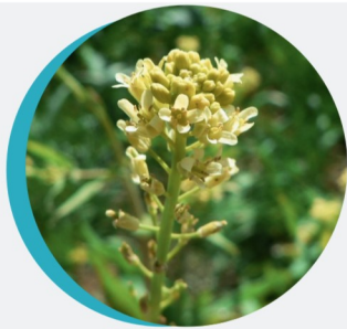
Myagre perfolié Myagrum perfoliatum L.