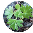
ALCHÉMILLE DES CHAMPS