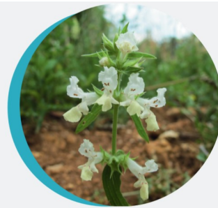
Epiaire annuelle Stachys annua (L.)