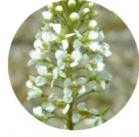
TABOURET DES CHAMPS