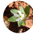
ANDROSACE DES CHAMPS