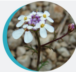
Ibéris penné Iberis pinnata L.