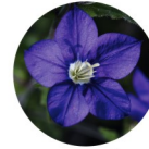
MIROIR DE VÉNUS