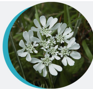
Orlaya à grandes fleurs Orlaya grandiflora (L.)