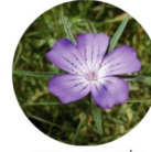
NELLE DES BLÉS