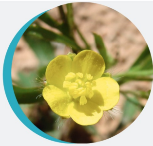
Renoncule des champs Ranunculus arvensis L.