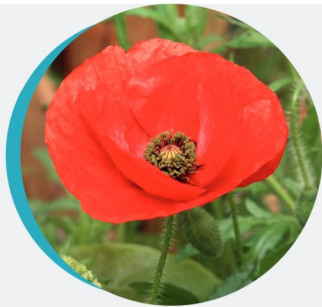
Grand coquelicot Papaver rhoeas L.