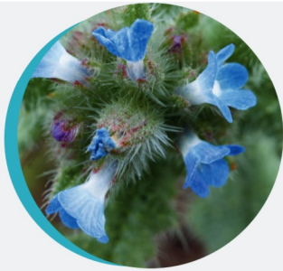
Buglosse des champs Lycopsis arvensis L.