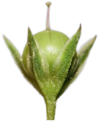
Mouron des champs