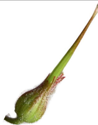
Géranium Herbe à Robert