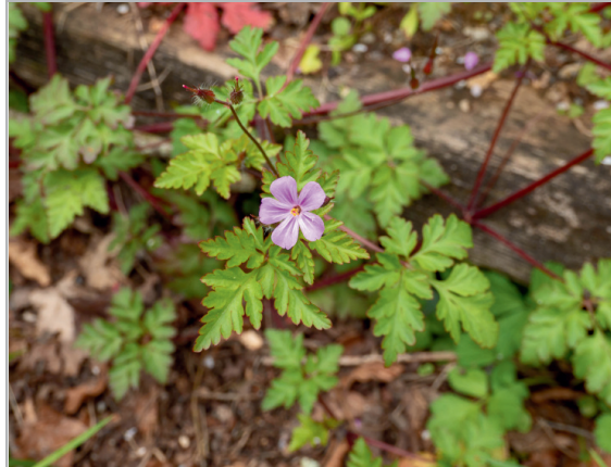
Géranium Herbe à Robert