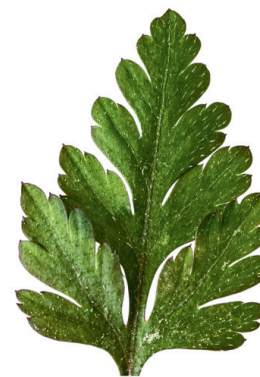
Géranium Herbe à Robert