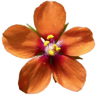
Mouron des champs