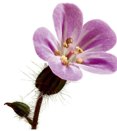
Géranium Herbe à Robert