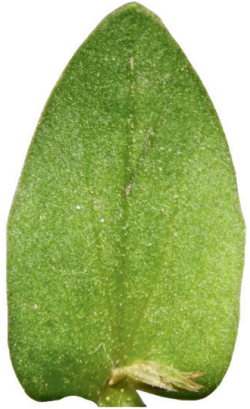
Mouron des champs